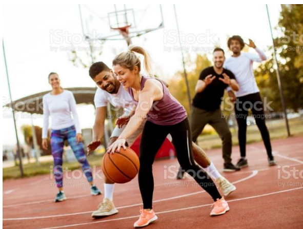
Pour pratiquer un sport