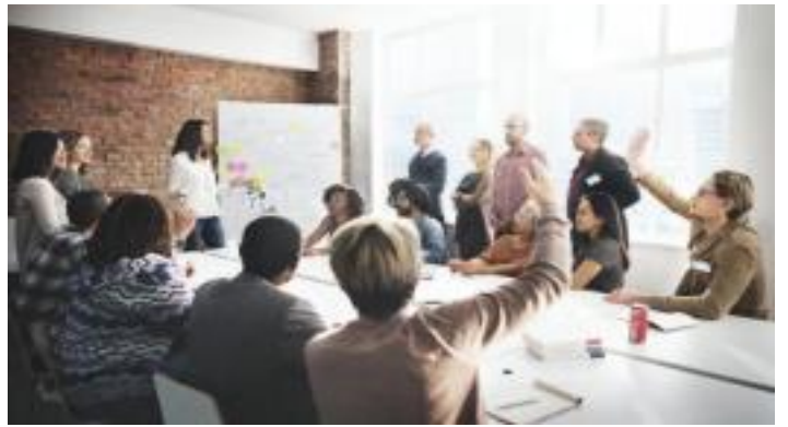
Pour suivre une formation