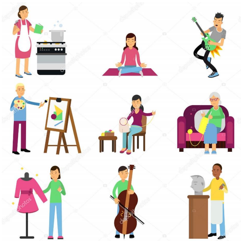
Pour échanger autour des loisirs