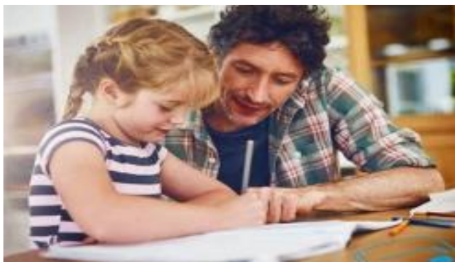
Pour aider ses enfants