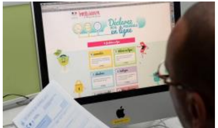
Pour naviguer sur Internet