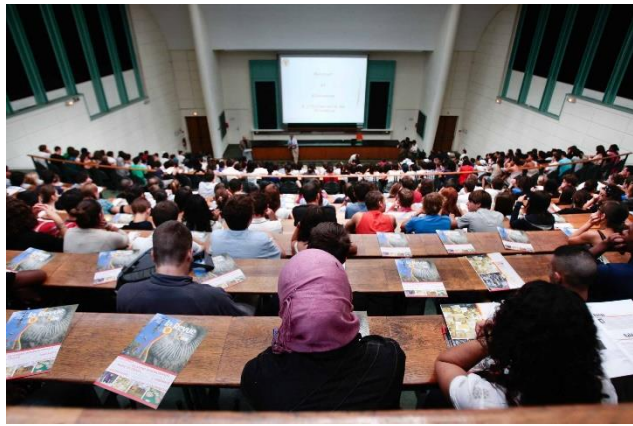
Les études supérieures