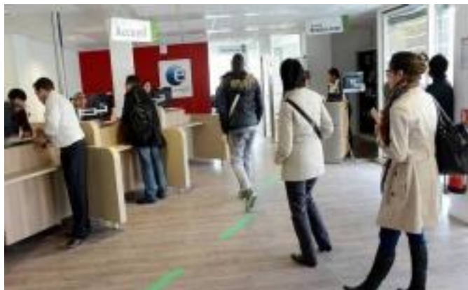
Pour chercher un travail