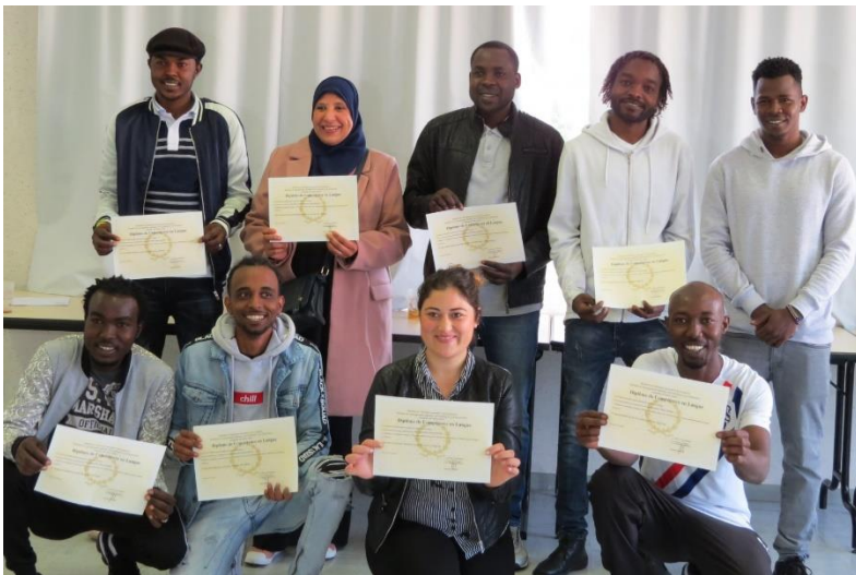
Diplôme ou attestation de formation linguistique