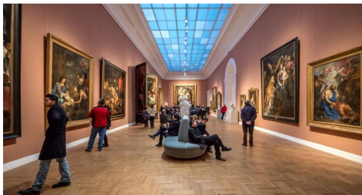
Pour découvrir la culture