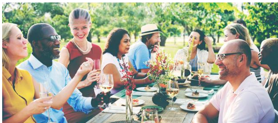
Pour rencontrer des amis