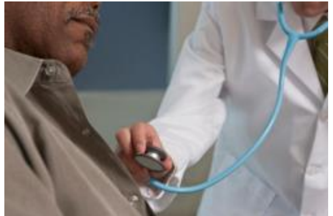
Pour comprendre des informations de santé